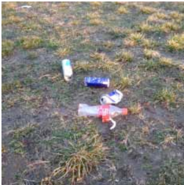
Abbildung 4: Verpackungsabfälle beim Parkplatz, Sommerbad

Die auffälligste Abfallgruppe sind Getränkedosen und Kunststoffflaschen. Um das Littering zu reduzieren oder zu vermeiden müssen entlang der Geh- und Radwege Abfallbehälter aufgestellt werden. Möglicherweise sollten Dosen und Flaschen gezielt gesammelt werden ("Gelber Sack").