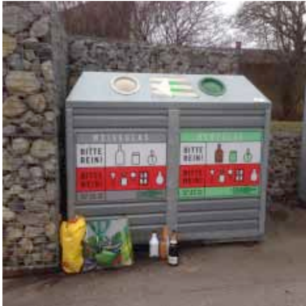
Abbildung 5: Überfüllte Sammelstelle für Altglas

Je bequemer (je mehr Container, je näher Sammelsystem bei HH) das System ist, desto effektiver ist das System, dh desto mehr sortenreine Abfälle können gesammelt werden und desto weniger Fehlwürfe gibt es.