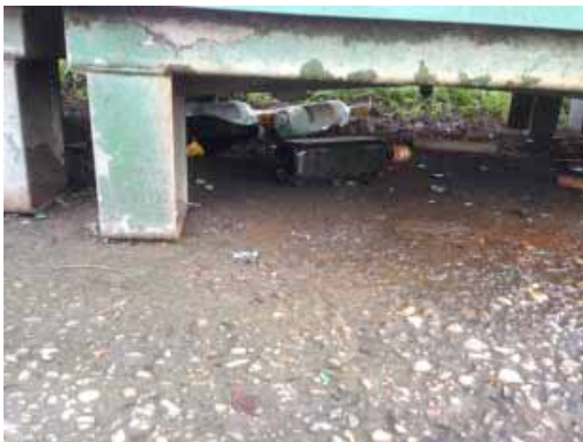
Abbildung 6: Glasbruch neben Sammelstelle

Abfällen neben den Containern stört massiv das Ortsbild und ist unter anderem durch die erhöhte Bruchgefahr eine massive Gefährdung für Tiere (Wildtiere, Hunde, Katzen,...), für Kinder, sowie für Passanten und auch für den Strassenverkehr (Fahrräder, Autos, ...).