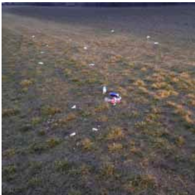
Abbildung 3: Littering in Grünstreifen

In letzter Zeit fallen besonders die vielen weggeworfenen Abfälle auf, insbesondere Getränkeflaschen, Kunststofffolien, Papier und Getränkedosen. Es gibt kaum einen Weg an dem keine Abfälle zu finden sind.